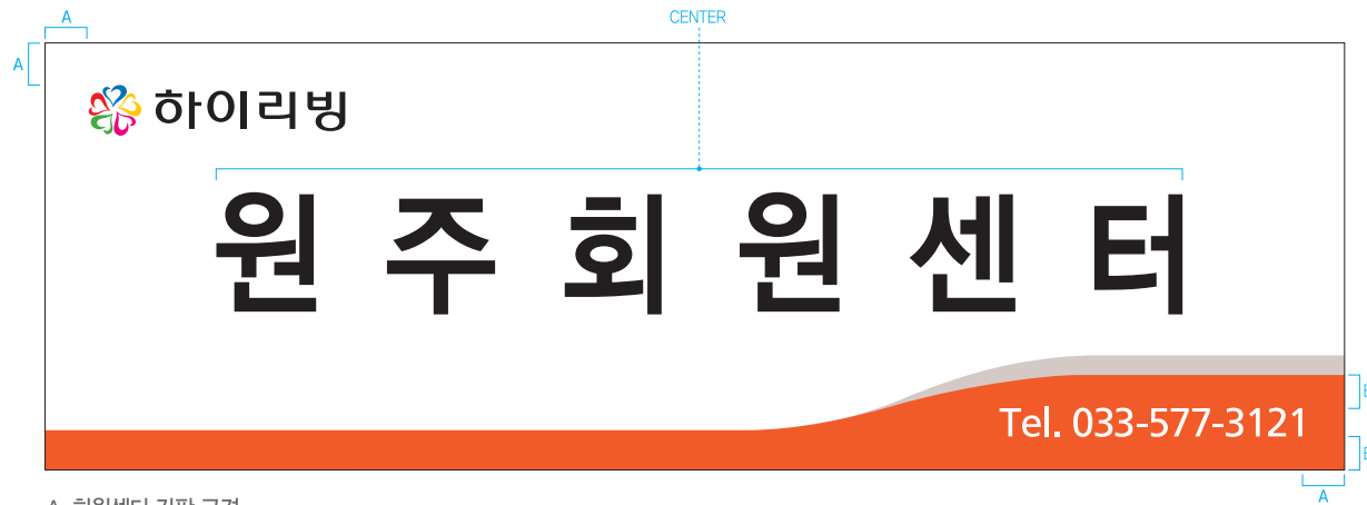
A. 회원센터 간판 규격

상단(좌측) : 하이리빙 규정 로고 · 중단(중앙) : 하이리빙 회원센터명 · 하단(우측) : 센터 운영회원이 추가로 기재하고자 하는 정보기재(연락처 등) 단, 회사로 오인할 수 있는 표현(로고, 상호, 주소 등) 사용이 불가함.